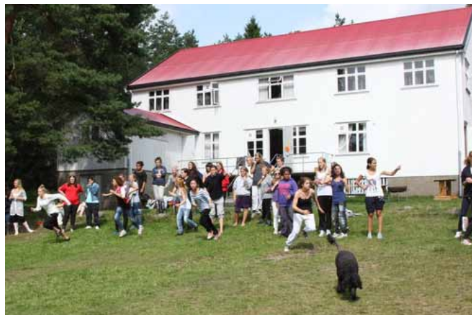
Sletta leirsted skal oppgraderes våren 2011 med midler fra Sodexo