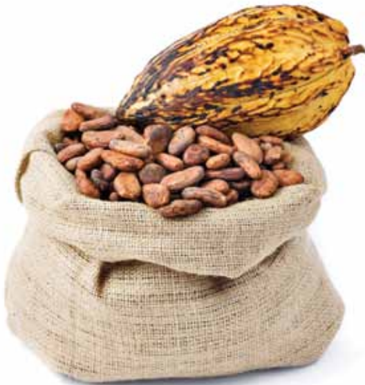
Kakaofrukt med frø

I september 2010 lanserte Sodexo som første aktør i bransjen varm sjokoladedrikk som er sertifisert av Rainforest Alliance. Vi har byttet ut all sjokoladedrikk, tilsvarende 5 millioner kopper pr. år! Byttet kom etter at det tidligere samme år ble avdekket forhold rundt kakaoprodusenter i Vest-Afrika som strider i mot Sodexo sine etiske prinsipper. Det ble avdekket bruk av barnearbeid og farlig bruk av arbeidsredskap. Vi tok umiddelbart kontakt med våre leverandører på sjokolade og kakao og krevde dokumentasjon på tiltak for å bedre denne situasjonen. Resultatet av dette ble at Sodexo fra høsten 2010 kun benytter kakao fra Freia/Kraft Foods som er sertifisert av Rainforest Alliance. På den måten sikrer vi at kakaoen er produsert under verdige og miljøvennlige forhold.